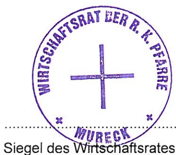
Siegel des Wirtschaftsrates

Änderungen bzw. Ergänzungen sind an den im Folgenden genannten Stellen eingearbeitet: